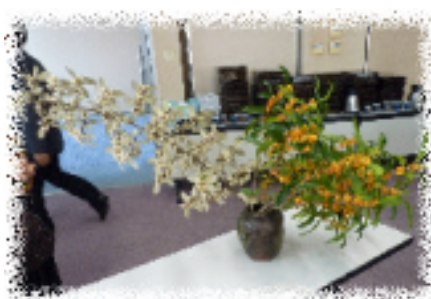
「キンモクセイ」と「ヤマグミ」 掘様、いつもありがとうございます。

いろんなアイデアを受付いたしますので、早めに親睦委員または事務局へ連絡を宜しくお願い致します。