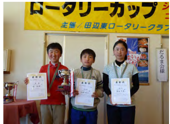
入賞者 小学生の部