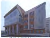
日高看護専門学校 看護専門学校新築工事 (御坊市外五ヶ町病院経営事務組合)