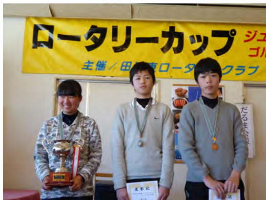
入賞者 中学生の部