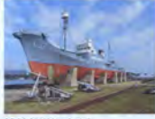
捕鯊船(第1京丸) 陸揚展示場整備事業(太地町)