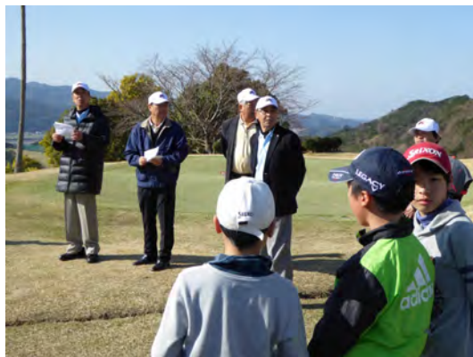
競技の説明をする実行委員

本大会は、当田辺東ロータリーが主催し、実行委員会のメンバーは全て当クラブ員で構成されています。3月26日にラビーム白浜G.C.で開催されました。県内はもちろん、県外からは兵庫県・大阪府・奈良県から沢山のジュニアゴルファーの参加を頂き、晴天とはいえ、時折強風の吹く中ちびっ子達の一生懸命のプレーに多くの拍手が送られました。この大会は「紀伊山地の霊場と参詣い道」が世界遺産登録されたことにちなんで開催されて、今年で10回目を向えます。ジュニアゴルファーが競技を通じて、ゴルフのルールやエチケットそしてマナーの習得、並びにゴルフ技術の向上を目指し、ゴルフに限らず、健全で健康・活発な子供たちになって欲しいという願いで続けられています。来年も同時期に同会場で開催の予定です。