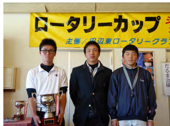
入賞者 高校生の部