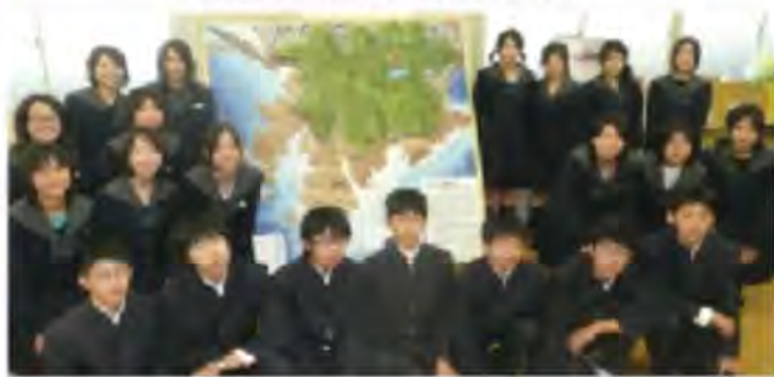
和歌山県立向陽中学校(和歌山市) 生徒による天神崎の立体模型

こうした本会の活動は、平成12年、(公益社団法人)日本ユネスコ協会連盟から「プロジェクト未来遺産」として登録を受けている。そして、この秋には、串本町からみなべ町の海岸域が、吉野熊野国立公園に編入されることになり、今後は天神崎も国立公園内ということになる。これを機会に、本会としても、この自然環境の大切さをより一層踏まえて、天神崎一帯の自然を保全し、また、多くの人々にこの自然の大切さを知っていただく努力を、今後とも続けていきたいと考えております。