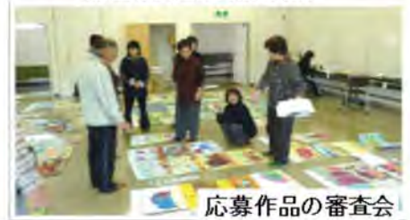
応募作品の審査会 (600点)