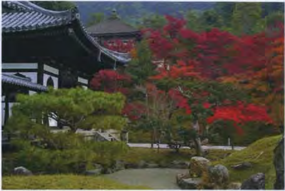
高台寺：庭園から霊屋(おたまや)を望む