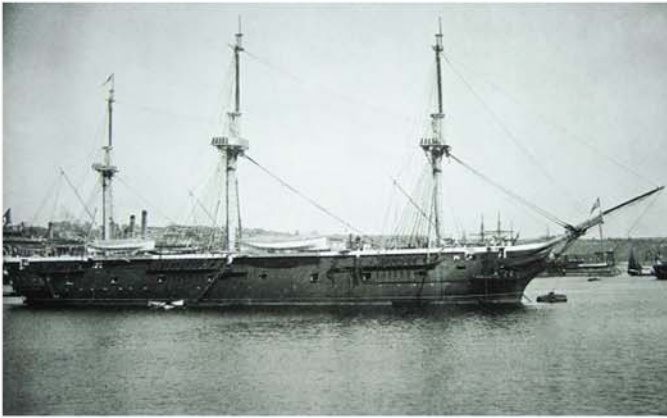
軍艦エルトゥールル号