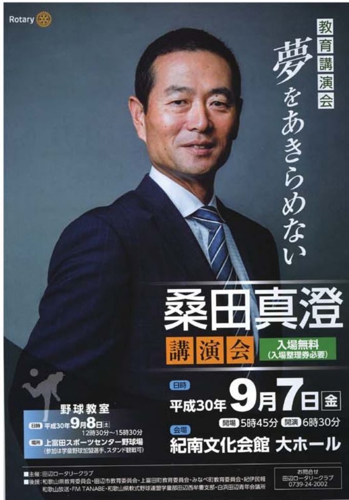
桑田真澄講演会展示タペストリー 田辺東ロータリークラブ様