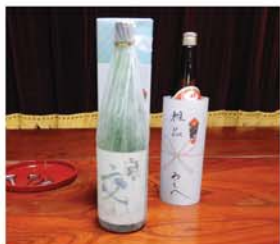
中嶋会長ありがとうございます。 あしべの女将ありがとうございます。