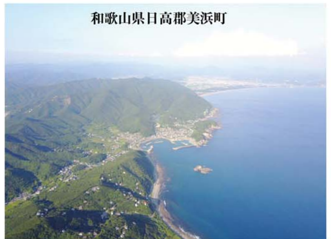
和歌山県日高郡美浜町

人口減少傾向は日ノ岬の麓にある三尾地区で特に強く、高齢化が進むと同時に少子化も著しく、平成20年には三尾小学校が廃校となっています。