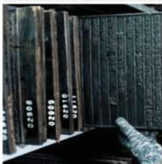
グエン王朝の木の文書