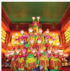
王室の裁判所の音楽