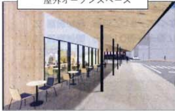
屋外オープンスペース