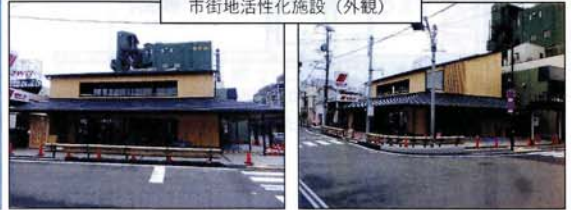
市街地活性化施設（外観）