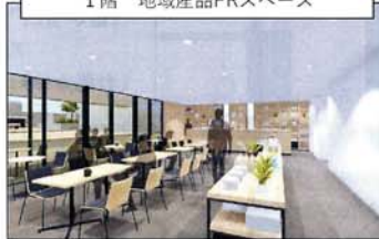
1階 地域産品PRスペース