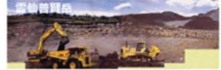
バックオフィスから 遠隔操作

遠隔・自動化 1994年から 雲仙普賢岳無人化施工 災害復旧・特殊現場における遠隔操作導入