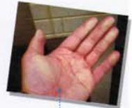
古いガードレールに触れると白い粉が付くのも、チョーキングが起きているからなんです!

チョーキングは、塗膜表面の樹脂が劣化することにより、塗膜内の顔料が露出し、粉となって現れた状態です。これより劣化が進むと塗膜としての「役割」を果たせず、躯体そのものを傷めてしまう可能性があります。劣化が進行してからの塗装工事は、塗装の他にさまざまな箇所の補修や補強が必要となるケースが多く、必然的に工事費の額も大きくなってしまいます。そうなる前に、外壁塗装は躯体の損傷が始まっていない段階で行うことをおすすめします。