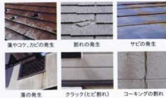
チョーキングの他にもさまざまな「塗り替えのサイン」があります