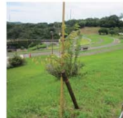
クマノザクラの経過